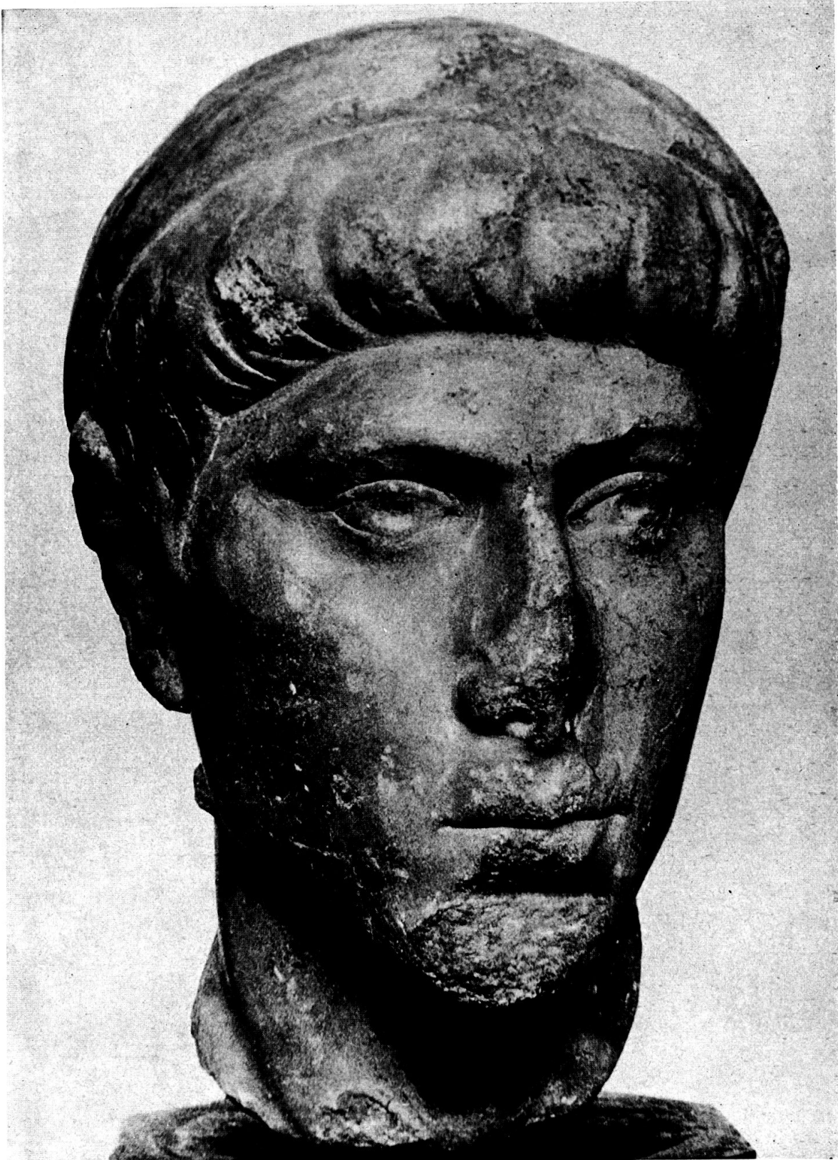
Tafel 1. Constantius II. als Caesar, verschollen.