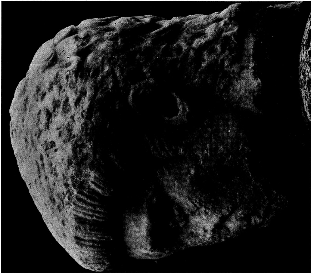
Tafel 3. Constantius II. als Caesar (?), Istanbul.